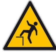
Chute de hauteur