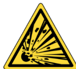
Utilisation de produits explosifs