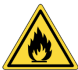
Utilisation de produits inflammables