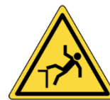
Chute de hauteur