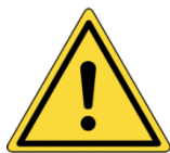
Inhalation de produits dangereux