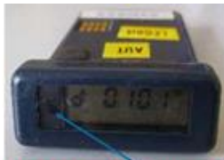
ALERTE sonore et Lumineuse

En cas de déclenchement du dosimètre indicateur ou de doute, contacter le PCP Lecoadou (112 depuis un téléphone fixe ou 02 33 95 55 00 depuis un portable).